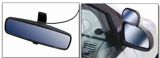
Abb. können abweichen

Wir sind der Partner für den Vertrieb und Einbau von Fahrschul-Doppelbedienungen der Firma Veigel Automotive. Optional ist ein Wippschalter zum Deaktivieren des Warnsignals bei Betrieb außerhalb von Prüfungen erhältlich.