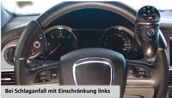
Bei Schlaganfall mit Einschränkung links