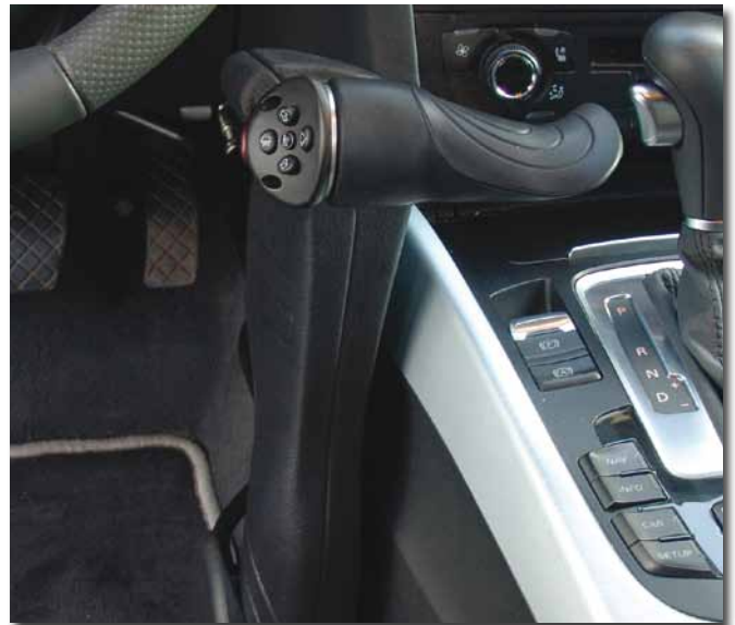
Abb. Multima3 MFD1