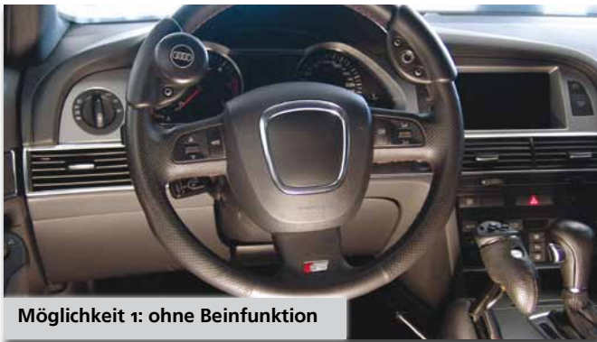
Möglichkeit 1: ohne Beinfunktion

Durch einfaches Umstecken des Standard-Drehknopfes und des kabellosen Infrarot-Multifunktionsdrehknopfes 1 oder 2 (Fernbedienung für die wichtigsten Funktionen wie Blinker, Wischer, Licht, Hupe usw.) stellen Sie Ihr Fahrzeug in wenigen Sekunden auf die Bedürfnisse Ihres Fahrschülers ein (Abbildungen zeigen MFD2, Drehknopf und Multimag in Designlinie).