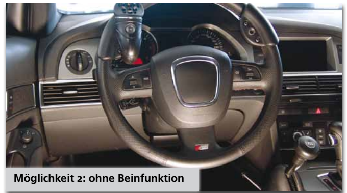
Möglichkeit 2: ohne Beinfunktion