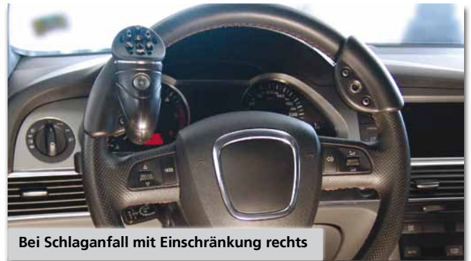
Bei Schlaganfall mit Einschränkung rechts